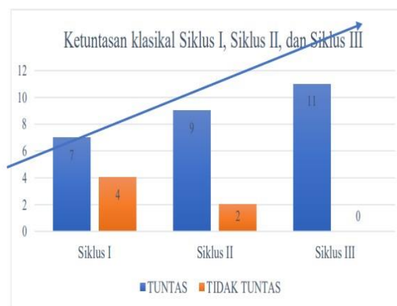
Grafik. 1. Data Hasil Observasi Siswa pada Siklus I, siklus II, dan III

Siklus I Hasil belajar siswa siklus I pertemuan I dan pertemuan II dapat diketahui melalui tes akhir siklus. Dari data yang diperoleh, ada 4 dari 11 siswa yang memenuhi nilai Kriteria Ketuntasan Minimal (KKM) yaitu 70 sehingga ketuntasan klasikal yang dicapai pada siklus I yaitu 36,3% atau berada pada kategori “kurang sekali”. Hal ini berarti masih ada 7 siswa yang belum mencapai nilai KKM dengan persentase ketidak tuntas yaitu 63,6%. Hasil belajar siswa siklus II pertemuan I dan pertemuan II dapat diketahui melalui tes akhir siklus. Dari data yang diperoleh, ada 9 dari 11 siswa yang memenuhi nilai Kriteria Ketuntasan Minimal (KKM) yaitu 70 sehingga ketuntasan klasikal yang dicapai pada siklus II yaitu 81,8% atau berada pada kategori “Sangat Baik”. Hal ini berarti masih ada 2 siswa yang belum mencapai nilai KKM dengan persentase ketidak tuntas yaitu 18,1%. Hasil belajar siswa siklus III pertemuan I dan pertemuan II dapat diketahui melalui tes akhir siklus. Dari data yang diperoleh, ada 11 dari 11 siswa yang memenuhi nilai Kriteria Ketuntasan Minimal (KKM) yaitu 70 sehingga ketuntasan klasikal yang dicapai pada siklus III yaitu 100% atau berada pada kategori “Sangat Baik”.