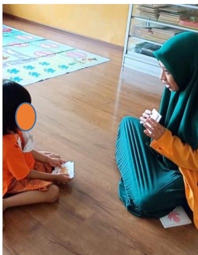
Gambar 3. Langkah 1 Perkenalan Emosi

Sasaran atau peserta program kerja ini ditujukan kepada Anak Penerima Manfaat Kelas A dan B yang berusia 3-5 tahun. Pelaksanaan program dilakukan diruangan pengabdian dengan mengajak dua anak sekali pelaksanaan. Untuk mengetahui perubahan kemampuan pengenalan jenis emosi anak, pengabdian melakukan observasi selama pelaksanaan program. Berikut dokumentasi pelaksanaan kegiatan dapat diamati pada gambar.