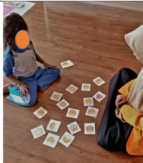
Gambar 4. Langkah 2 Menyebarkan dan Menunjuk Kartu

Pada gambar diatas dapat dilihat bahwa pengabdian melakukan langkah awal dari pelaksanaan yaitu perkenalan emosi. Pengabdian pertama-tama memperlihatkan flash card dan menyebutkan bahwa gambar-gambar tersebut disebut emoji. Kemudian pengabdian memperlihatkan satu persatu kartu dan meminta anak untuk menyebutkan emosi atau ekspresi apa yang ada pada kartu, jika anak tidak tahu maka akan disebutkan dan diekspresikan oleh pengabdian.