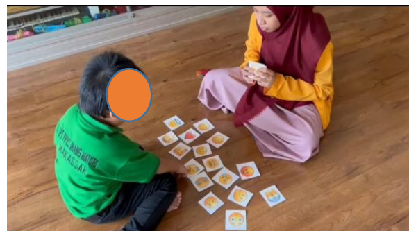
Gambar 5. Langkah 3 Mengekspresikan Emosi Sesuai Emoji

Pada gambar di atas dapat dilihat bahwa pengabdian melakukan langkah kedua dari pelaksanaan yaitu menyebar dan menunjuk kartu. Pengabdian menyebarkan kartu secara acak dilantai, dan secara random disebutkan ekspresi emosi dari emoji yang ada di flash card dan meminta anak untuk mengambil kartu yang sesuai.