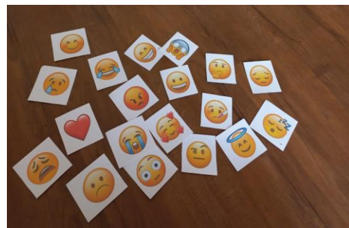
Gambar 2. Hasil Pembuatan Flash Card

Pada tahap persiapan, pengabdian mempersiapkan segala persiapan yang berkaitan dengan kegiatan yang akan dilaksanakan dan membuat flash card . Beberapa hal utama yang dipersiapkan adalah kertas jilid, gambar emoji, laptop, printer, gunting dan kertas laminating. Pembuatan flash card dimulai dengan menyusun emoji yang akan digunakan, kemudian mencetak dengan kertas jilid, selanjutnya melaminating hasil cetakan dan menggunting berbentuk segi empat. Dalam hal ini, flash card berisikan gambar emoji dibagian depan dan nama ekspresi emoji tersebut dibaliknya. Untuk membuat flash card dapat digunakan berkali-kali dan bertahan lama, pengabdian melaminating flashcard sehingga gambar tetap jelas dan tidak mudah rusak.