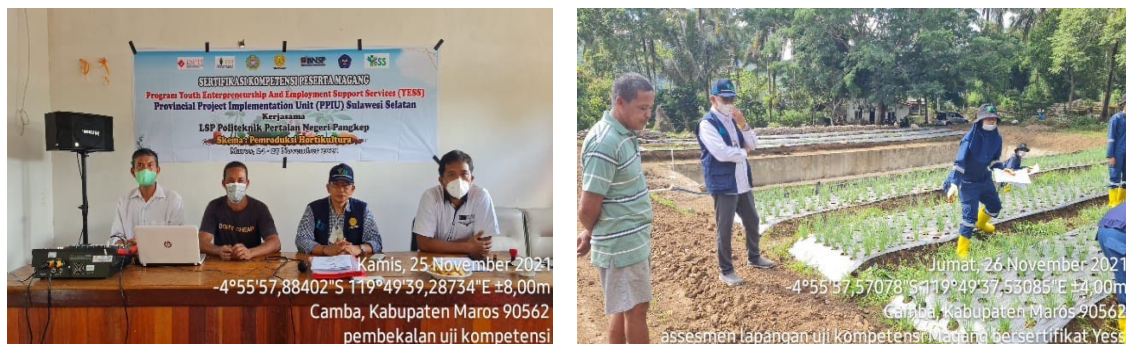
Gambar 5. Pembekalan Uji Kompetensi & Assesmen Lapangan

Pelaksanaan Sertifikasi peserta magang dilaksanakan oleh LSP Politeknik Pertanian yang telah mendapatkan lisensi LSP P3, yaitu LSP Pertanian dan LSP Peternakan. Pelaksanaan uji kompetensi dilaksanakan pada tanggal 24-27 November 2021.