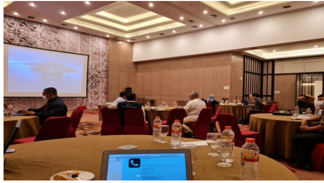
Gambar 1. FGD Permagangan di Bogor