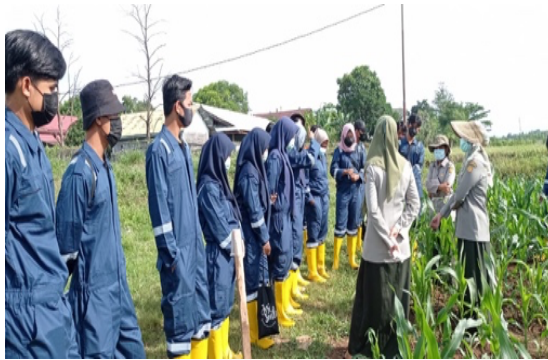
Gambar 2. Suasana magang di Balitsereal Maros

Skema pemagangan tersebut diatas ditempuh dalam waktu 3 (tiga) bulan masa pemagangan. Dalam pemagangan masing masing tempat magang menyiapkan mentor yang bertanggung jawab membimbing dan mengarahkan peserta magang hingga selesainya masa pemagangan dengan berpedoman pada kurikulum dan silabus magang.