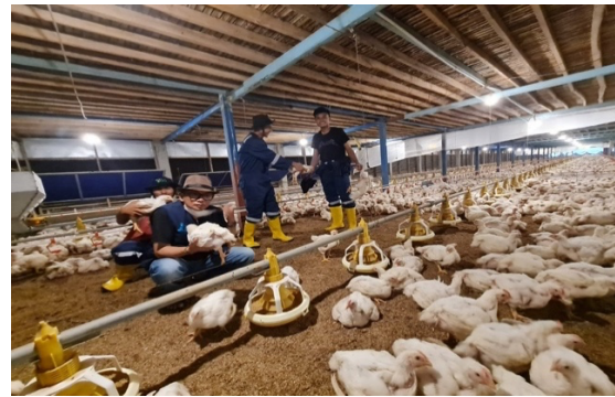
Gambar 3. Suasana magang di Bintang Sejahtera Bersama

Pada Tanggal 1 Oktober dilakukan kembali penempatan peserta Magang di dua lokasi pemagangan, masing-masing di P4S Assamayama Kabupaten Maros sebanyak 11 orang dan P4S Tamalanrea di Kabupaten Bulukumba sebanyak 14 orang, sehingga dengan demikian total peserta pemagangan bersertifikat dalam negeri tahun 2021 di PPIU Sulawesi Selatan sebanyak 105 Orang dari target 80 orang. Jumlah peserta pemagangan di masing masing lokasi tsaat ini disajikan pada Tabel 2.