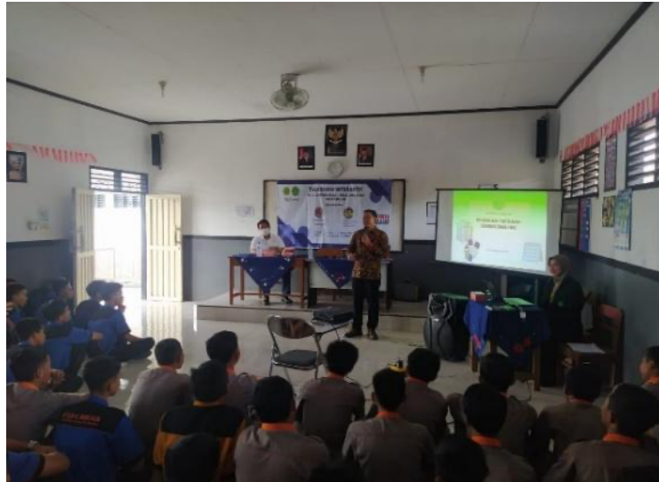
Gambar 3. Pemaparan Materi