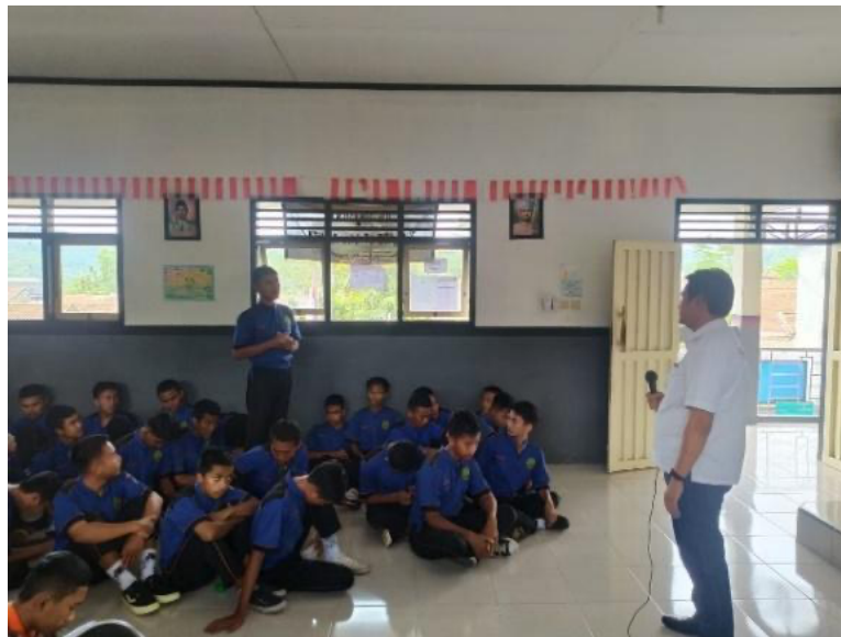
Gambar 4. Diskusi dan Tanya Jawab

Kegiatan berjalan dengan antusiasme yang tinggi dari peserta yang berjumlah 192 peserta, dengan indikator banyaknya siswa yang aktif dalam sesi tanya jawab. Berikut data peserta berdasarkan kelas: