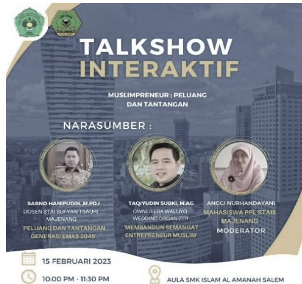
Gambar 2: Flyer Kegiatan