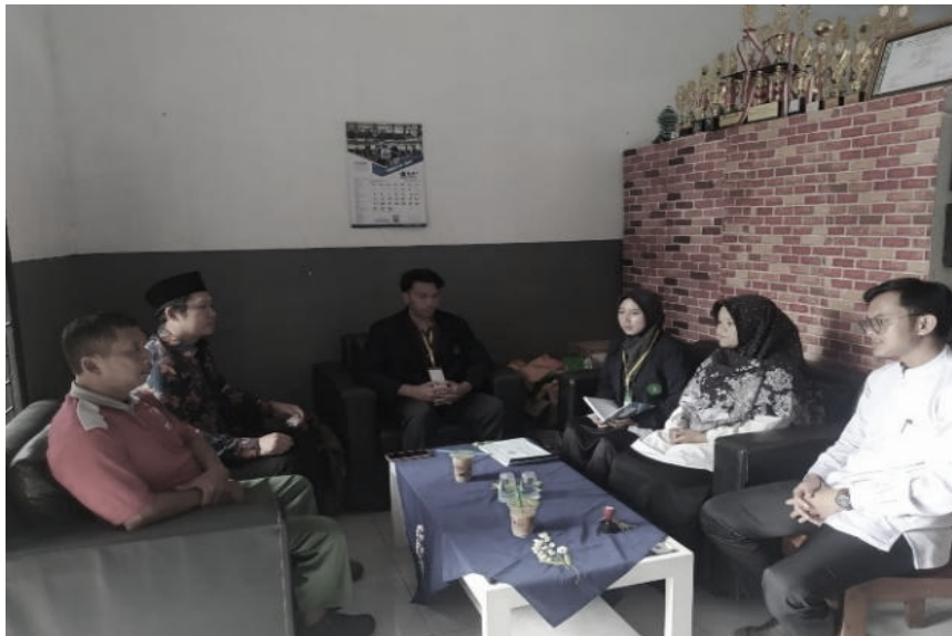
Gambar 1: Perencanaan Kegiatan