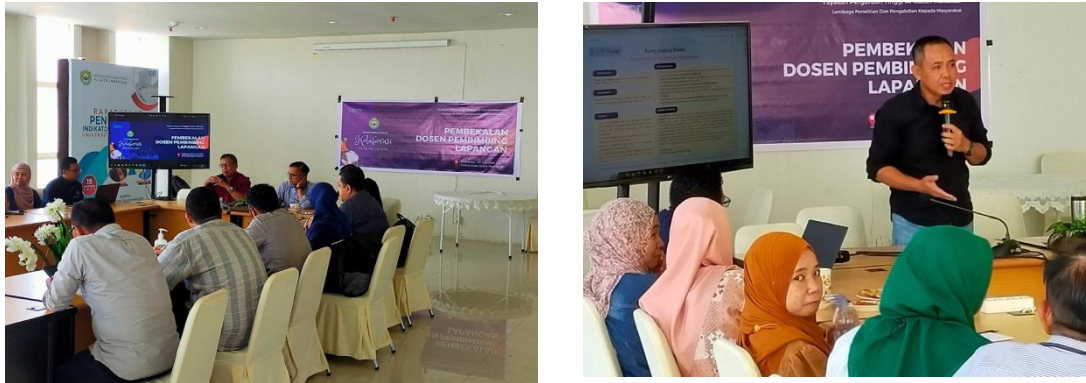
Gambar 3. Workshop Dosen Pendamping lapangan KKN Reguler 2023

melakukan pengabdian masyarakat, berkolaborasi mengimplementasikan ilmu pengetahuan dan teknologi dalam pemanfaatan sumber daya alam desa terutama untuk kesejahteraan masyarakat pedesaan (Bakri et al., 2015).