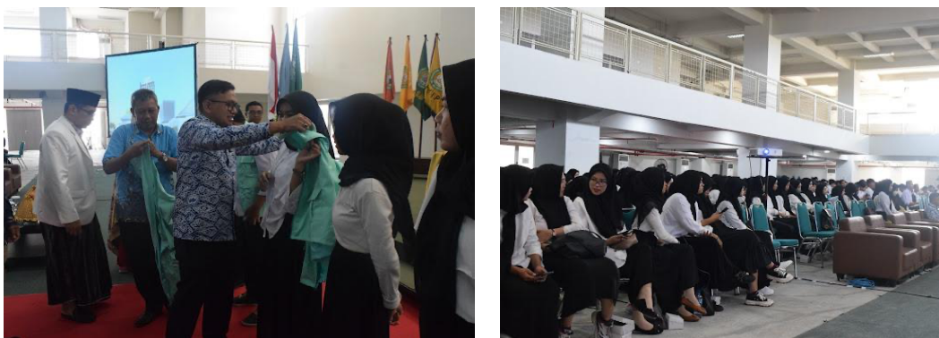
Gambar 2. Pembekalan dan Pelepasan Mahasiswa

Pembekalan mahasiswa dimaksudkan untuk memberikan pengetahuan kepada mahasiswa terkait dengan kebijakan-kebijakan kampus maupun daerah, utamanya di lokasi KKN. Demikian pula untuk mengupdate softskill mahasiswa sebagai bekal untuk transfer knowledge kepada masyarakat (Syardiansah, 2019; Umar et al., 2021). Oleh karena itu pada pembekalan ini sebagai narasumber selain dari pimpinan kampus juga dihadirkan unsur pemerintah daerah Kabupaten Maros. Kegiatan pembekalan ini dilaksanakan di auditorium KH. Muhyiddin Zain kampus Universitas Islam Makassar pada tanggal 5 Oktober 2023 dan dihadiri oleh seluruh mahasiswa KKN dosen DPL dan pimpinan Fakultas.