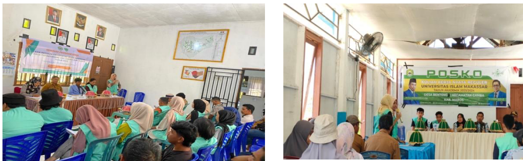
Gambar 5. Pelaksanaan Seminar Program Mahasiswa KKN

Dalam rangka transparansi dan penyempurnaan program kerja Mahasiswa KKN, dilakukan seminar program yang mengundang seluruh stakeholder desa, diantaranya kepala desa dan perangkatnya, tokoh masyarakat, tokoh pemuda dan tokoh perempuan untuk dapat memberikan masukan terkait penyempurnaan program, bahkan dalam seminar ini juga dilakukan lelang program agar masyarakat merasa memiliki dan bertanggung jawab terhadap program yang direncanakan oleh Mahasiswa KKN.