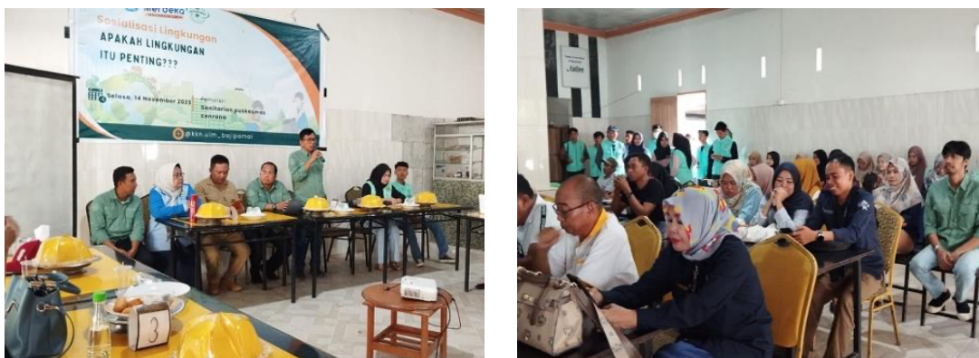
Gambar 8. Salah Satu Kegiatan Seminar Akhir Program Mahasiswa KKN dengan Tema Lingkungan

Sebelum mahasiswa ditarik ke kampus, maka evaluasi program yang dilaksanakan dalam bentuk seminar akhir. Sama halnya pada saat seminar awal, pada seminar akhir ini dihadiri oleh aparat desa dan tokoh masyarakat, selain mahasiswa dan dosen pembimbing lapangan. Kegiatan ini dimaksudkan untuk mengukur tingkat keberhasilan program kerja yang dilaksanakan oleh mahasiswa pada kegiatan KKN. Pada Seminar akhir ini disampaikan capaian program kerja, yang selesai seratus persen (100%) langsung diserahkan kepada pemerintah desa untuk dimanfaatkan dan dilakukan pemeliharaan, sedangkan program kerja yang belum rampung juga diserahkan kepada pemerintah desa untuk dilanjutkan pembangunannya dan tetap dipantau oleh mahasiswa dan dosen pendamping.