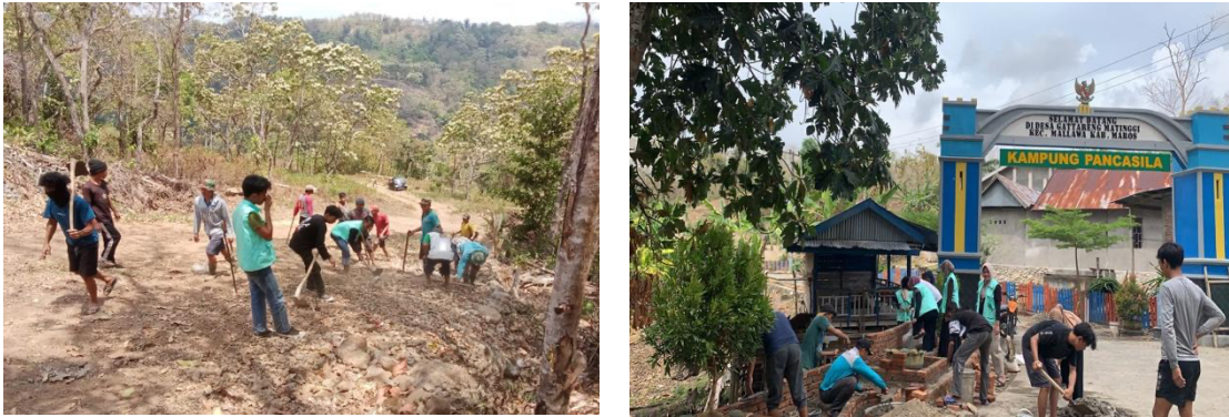
Gambar. 7. Pelaksanaan Kegiatan Fisik Mahasiswa KKN