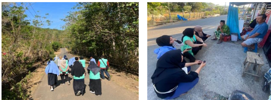
Gambar 4. Pengenalan Lokasi oleh Mahasiswa KKN

Setelah pemberangkatan mahasiswa KKN ke lokasi, maka hal yang pertama dilakukan adalah silaturahmi dengan tokoh-tokoh masyarakat yang dilanjutkan dengan pengenalan potensi Desa/lokasi. Pengenalan potensi desa/lokasi ini dilakukan dengan metode transek agar terpetakan potensi desa, baik potensi sumberdaya manusia maupun potensi sumberdaya alam (Hidayat et al., 2018). Hasil dari transek ini nantinya dibawa ke seminar awal dalam rangka penyusunan program. Selain hasil transek program kerja mahasiswa KKN juga melakukan sinkronisasi program dengan program yang ada, diantaranya RPJM Desa sehingga dalam pelaksanaannya tetap berkolaborasi dengan pemerintah desa. Transek ini juga dilakukan dengan harapan agar mahasiswa mengenal dan memahami lebih jauh karakter masyarakat setempat, agar mahasiswa dapat berbaur dan berkolaborasi tidak hanya dengan perangkat desa, namun mampu menyesuaikan diri dengan masyarakat setempat.