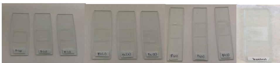
Gambar 2. Pengujian Homogenitas F1, F2, F3, K (-)

Dari data tersebut, dapat diketahui bahwa keempat sediaan essence yang diformulasi homogen. Hal ini, telah sesuai dengan penelitian tentang formulasi dan uji stabilitas fisik sediaan essence yang dilakukan oleh (Asanah, dkk., 2023). Homogenitas essence ditandai dengan adanya persamaan warna yang tersebar, tidak mengandung partikel padat yang tidak larut dan tidak terlihat gumpalan pada object glass.