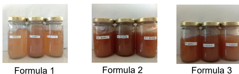
Gambar 1. Sediaan Gel Ekstrak Etanol Buah Sawo Manila ( Manilkara zapota L. )

Uji organoleptik dilakukan dengan mengamati visual sediaan gel meliputi bentuk, warna dan bau. Hasil dari uji organoleptik sediaan gel ekstrak etanol buah sawo manila dapat dilihat pada tabel berikut.